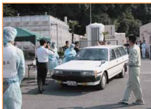
ドライブスルー診療の受付開始

国内および県内で強毒型の新型インフルエンザの感染が拡大している第三段階を想定しました。市内において既に新型インフルエンザ患者が発生し、学校や事業所の閉鎖を行うなど感染拡大防止に努めている状況で、明石市立市民病院はその受け入れ体制の強化が求められ、市対策本部、兵庫県明石市健康福祉事務所との連携の下、市内某所において陰圧式テントによるドライブスルー型発熱外来を設置し、外来診察を開始した。発熱外来の受診者のうち、呼吸困難のため入院が必要な重症患者が発生し、感染症指定医療機関が既に満床であるため、明石市立市民病院に入院受け入れの要請が入り、発熱外来に受診、感染病棟に入院した。