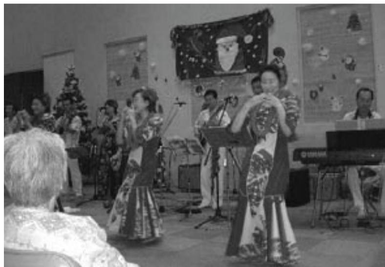
「院内コンサートのアンケート結果」

ります。紙面を借りて紹介させて頂きます。「かんごふさんへ。1週かんありがとう。わたしはおおきくなったらかんごふさんになるのがゆめです。かんごふさんのしごと、たいへんそうだけどなにかたいへんですか? てんてきぬくのつてむつかしいですか? つぎの水ようびあえたらいいね。かんごふさんがねつをだしたらどうするの? げんきでね。」