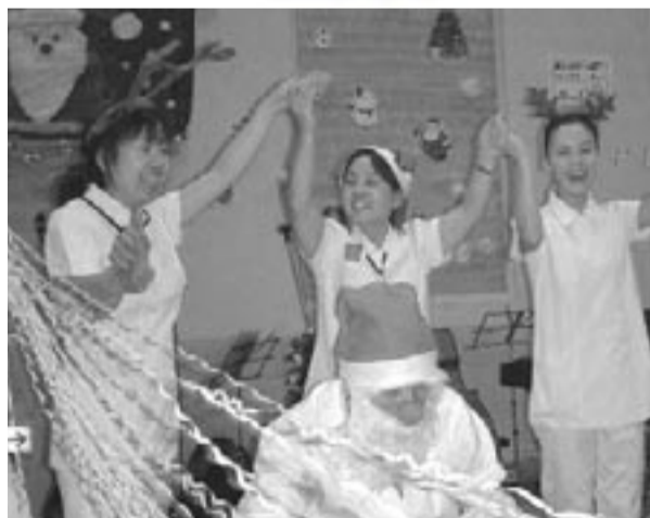
※ 昨年度のコンサート風景