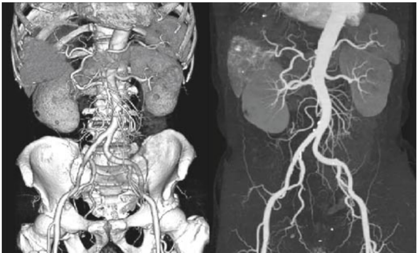
腹部 CT 立体画像

す。これにより骨や血管の高画質な3D(立体的)画像の作成や、心臓の血管(冠状動脈)の観察や心機能測定が可能となり、これまで より情報量の多い画像が提供できるようになりました。 このマルチスライスCT装置と既存のシン 2台で、それぞれの装置を有効に活用し、これまで以上に安全かつ効率的な検査を行なっています。 (放射線科)